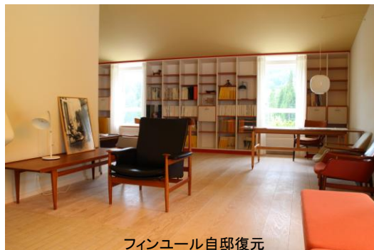
フィンユール自邸復元